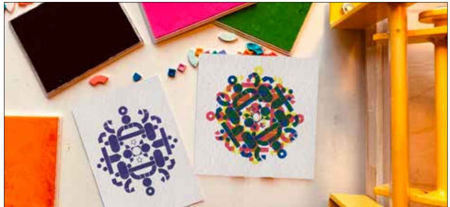
Erstmals bietet die vhs Kreativ-Kurse zum LEGO-Drucken s. rechte Seite (207459 f., 207457 f.)

Sa, 23.5., und So, 24.5., 10.00–14.00 Uhr vhs-Atelier in der Radstation, Wentzingerstr. 15 75 €